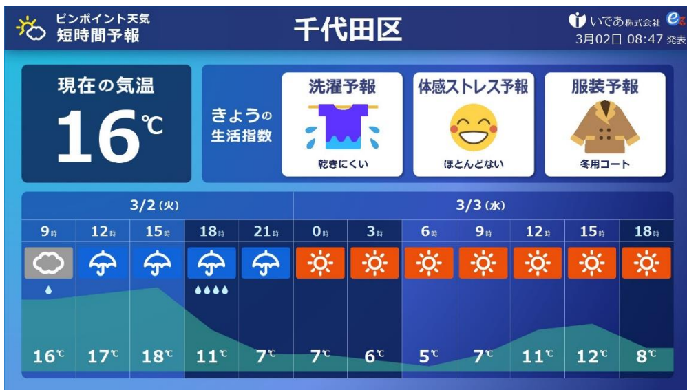
市区町村単位のピンポイント天気と健康生活予報（短時間）