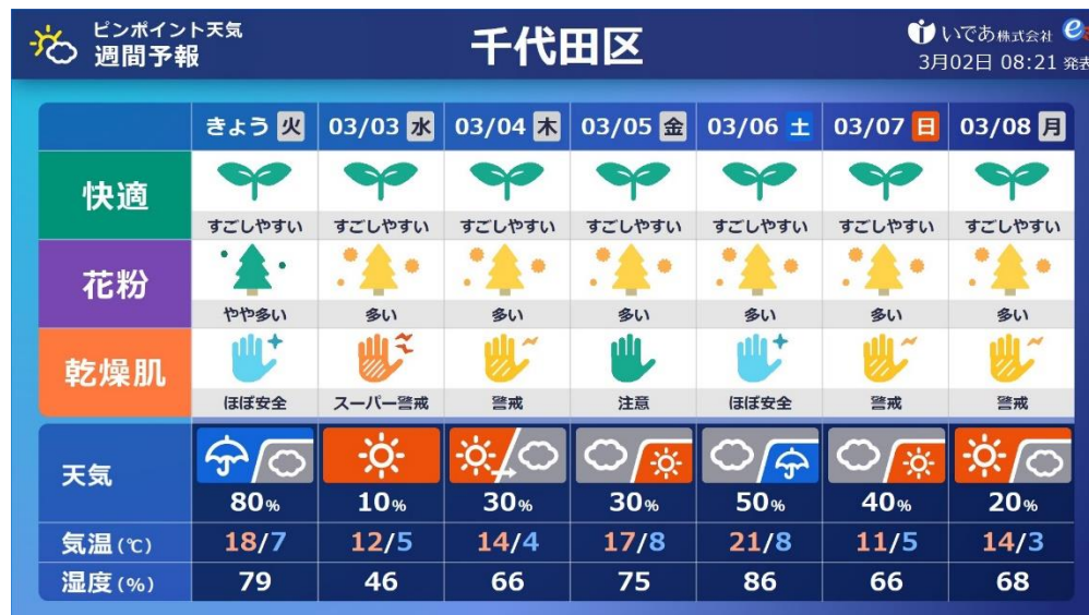
市区町村単位のピンポイント天気と健康生活予報（週間）